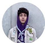
Rivierdolfijn Max STEURS 0493/766245

Mail de leiding: info@reynaert-beatrijs.be